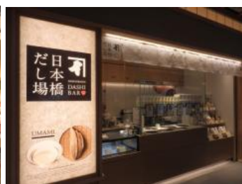
日本橋だし場 羽田空港店