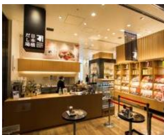
日本橋だし場 (にんべん日本橋本店併設)