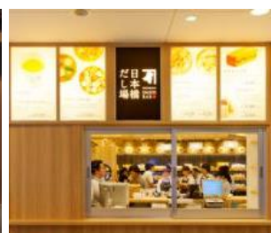
日本橋だし場+ EXPASA 海老名店