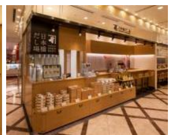
日本橋だし場 丸ビル店