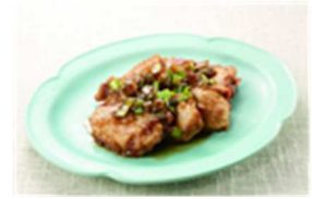
レシピ集より「薫る味だし油淋鶏」