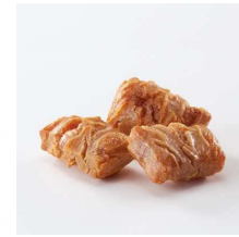
つゆの素ぬれおかき