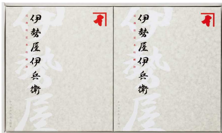
IFG100 10,000円 (2.5g×34袋)×2箱